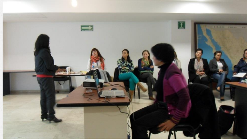
Docentes hospitalarios de diversos estados de la república mexicana, responsables de programa y profesionales relacionados con el tema en una sesión del Diplomado en Pedagogía hospitalaria 2013