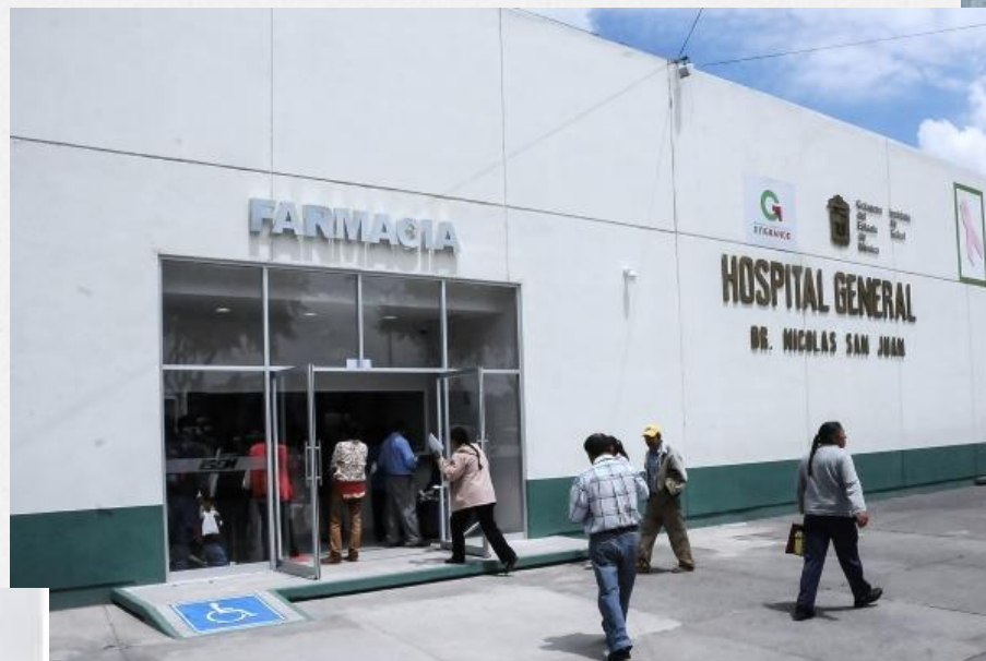
Hospital General Dr. Nicolás San Juan