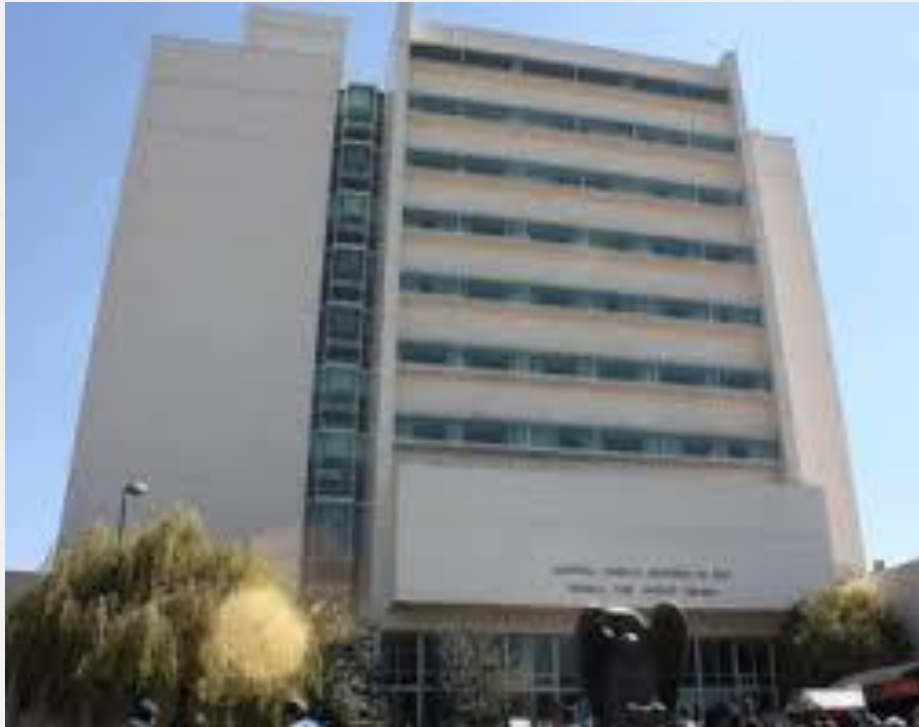
Clínica 220 IMSS