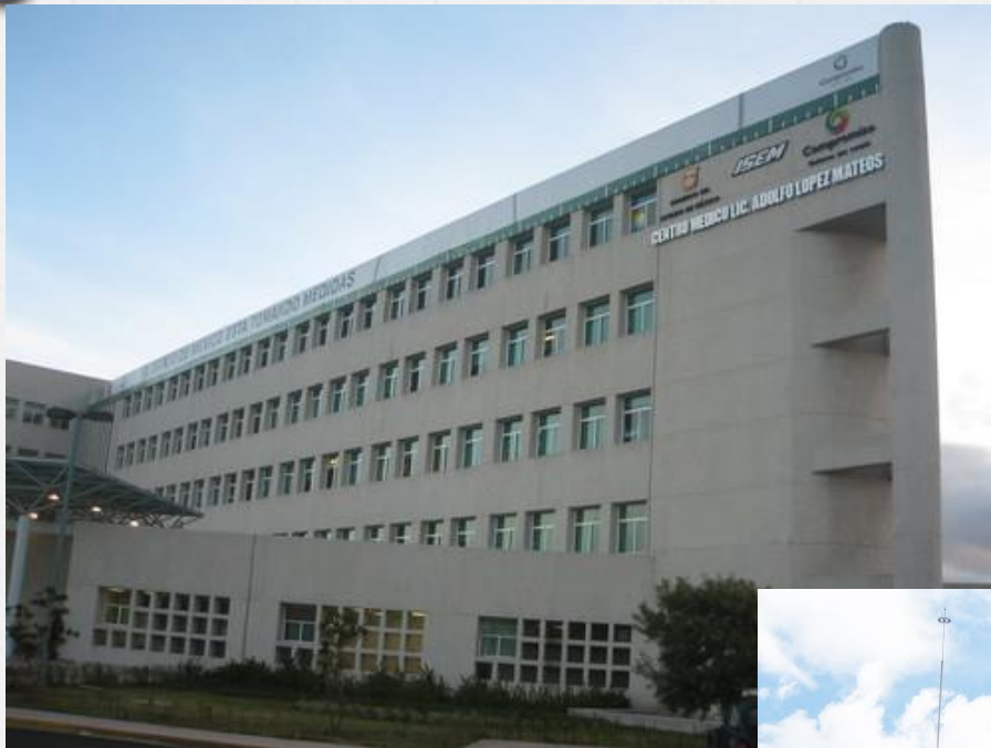
CENTRO MEDICO ADOLFO LOPEZ MATEOS