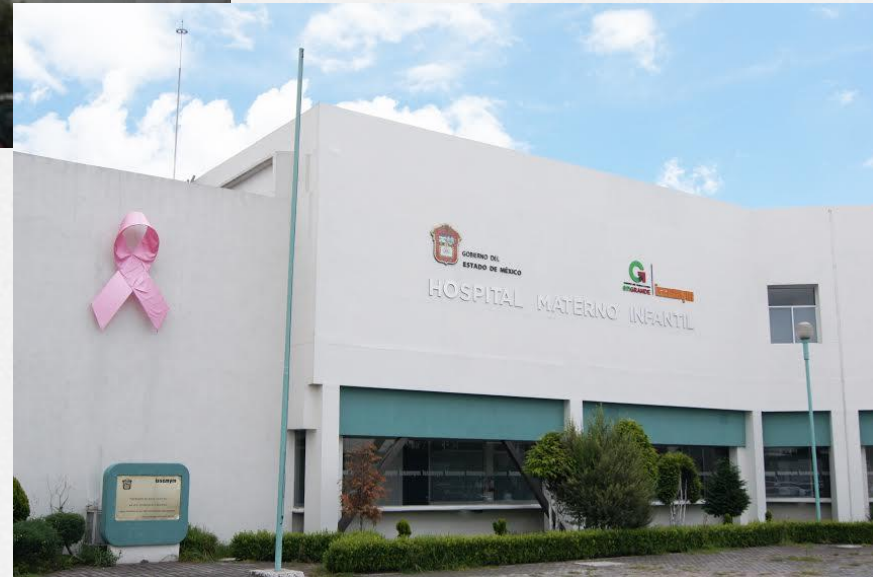
Hospital Regional Toluca ISEMMYM